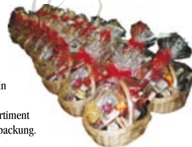
Geschenkkörbe in großer Auswahl

Bruttopreis inkl. MwSt. Versand: + 4,65 € inkl. Versandverpackung/Porto